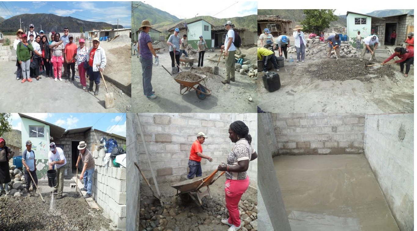
Grupo N°2 Casa de Patricia