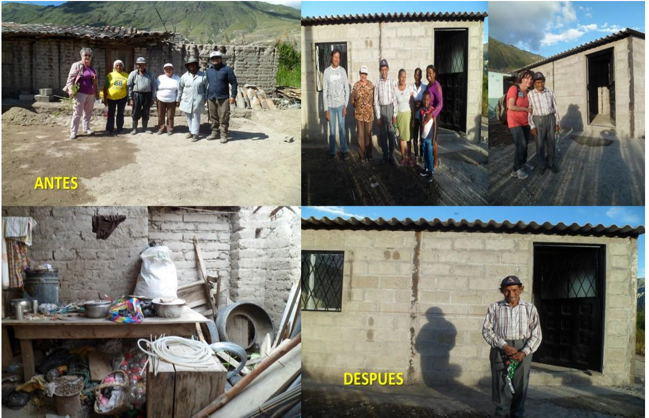
b) Construcción de Casa PATRICIA PALACIOS .