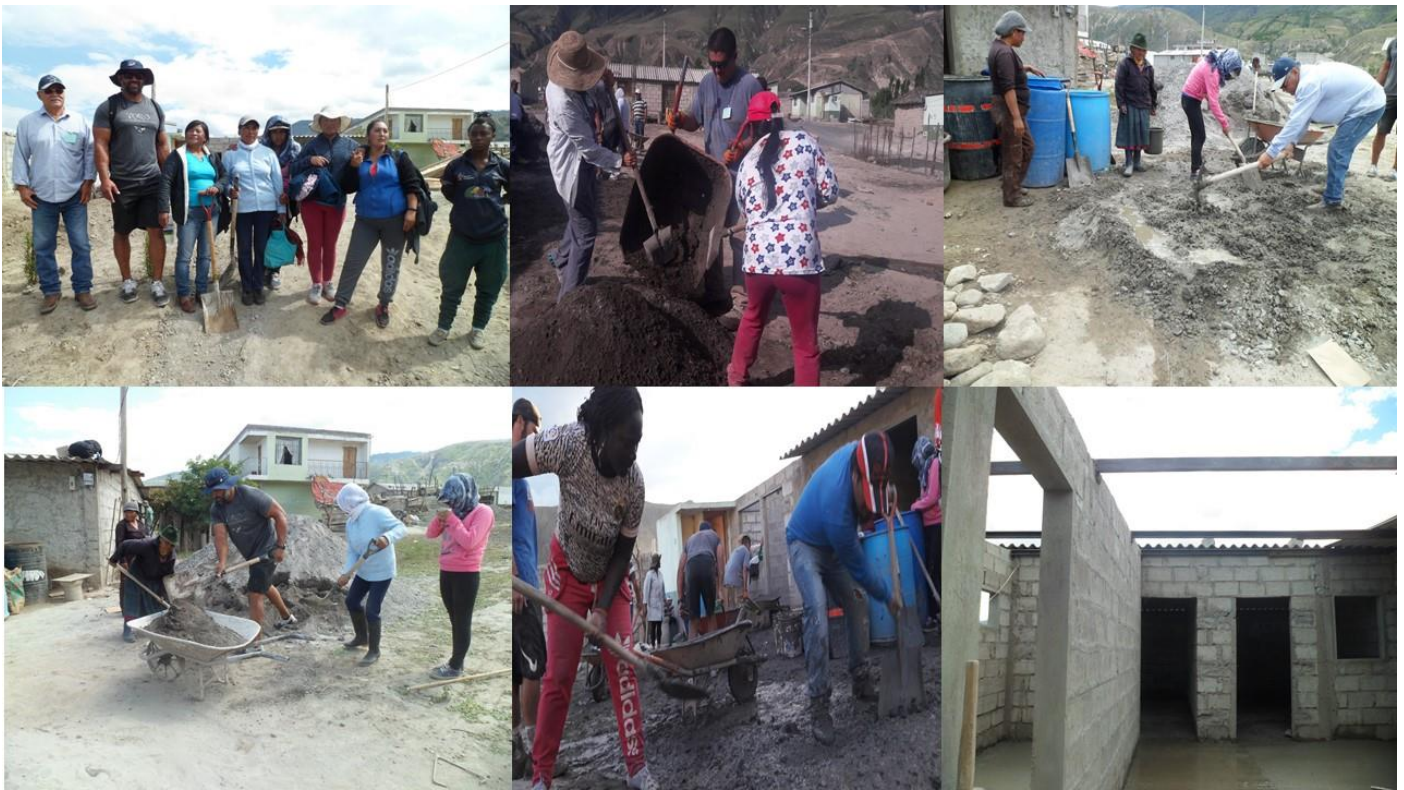
Grupo N° 3 Casa de Aguedita

Para realizar la fundición de los 154.78 m2 realizamos tres grupos de trabajo distribuidos en las tres casas. El total de personas trabajando fue 54 personas. (Voluntarios EEUU, Pusir Grande y Pijal Centro)